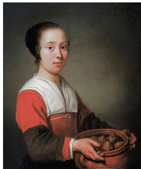
Albert Cuyp. Oliekoeken ca 1650

Nog even terugkomen op de oliebolletjes. Die waren er al heel lang. Alleen had men in de vorige eeuwen niet zo veel bakolie